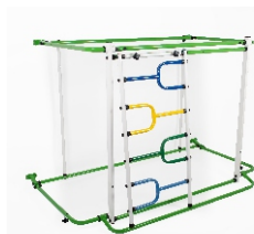
модуль МЕТАЛЛИЧЕСКИЙ ЛАЗ