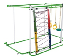
модуль ВЕРЕВОЧНЫЙ ЛАЗ