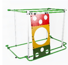
модуль ДЕРЕВЯННЫЙ ЛАЗ №1